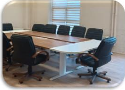
Lisansüstü sanal tez sınav savunma odası