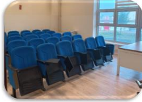
Yeni oluşturulan sınıf